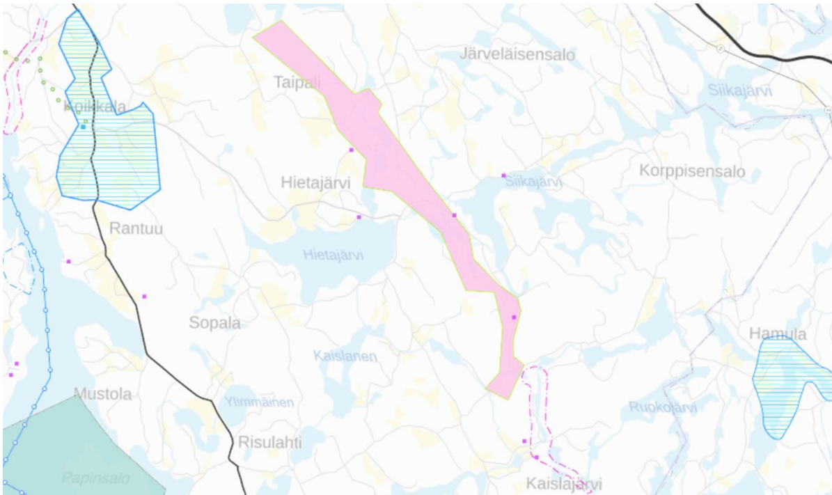
Kuva 3: Kohde 1, ote maakuntakaavojen yhdistelmästä Hietajärven yleiskaavan pohjoisosien osalta