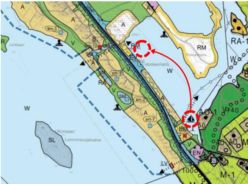
Kuva 2. Suunnittelualueen alustava rajaus punaisella katkoviivalla