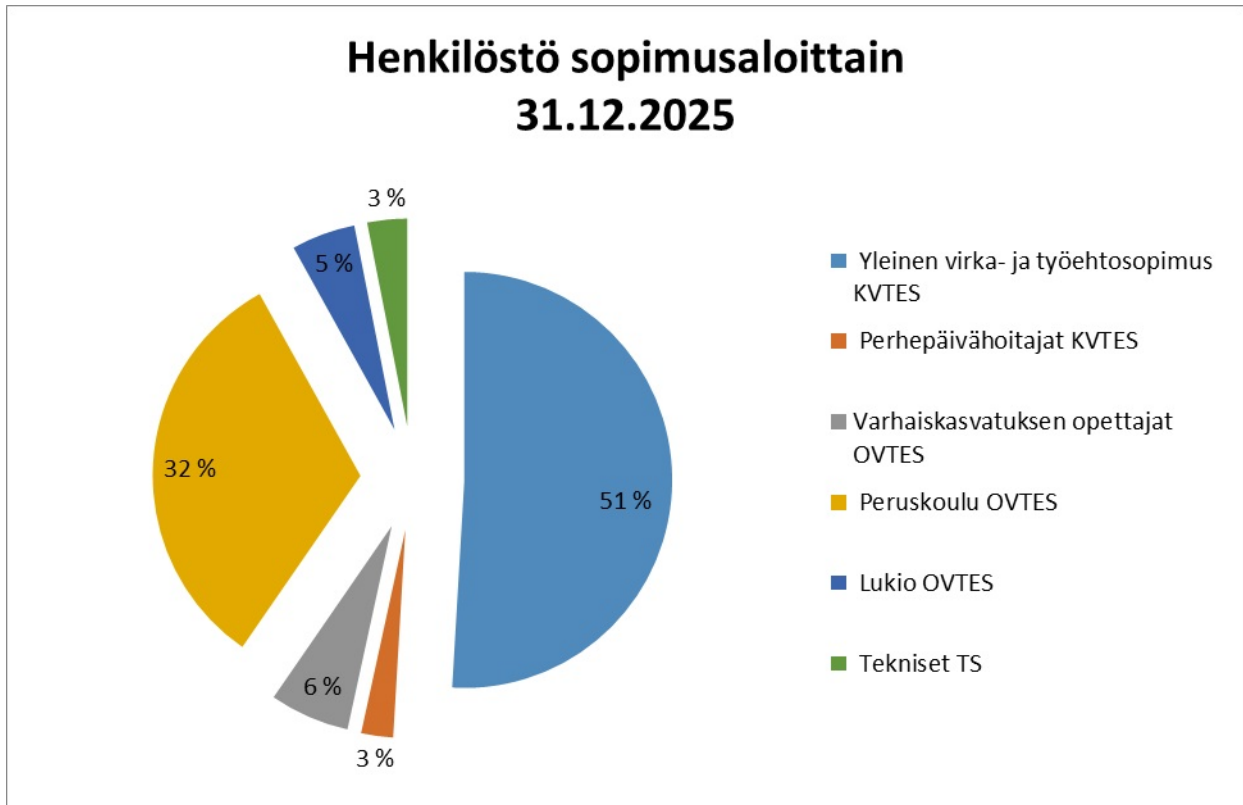
Kuvio 3. Henkilöstö sopimusaloittain 2025.